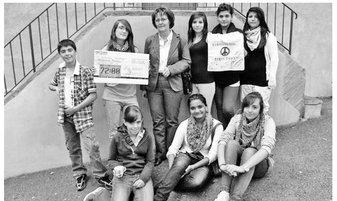
Die Jugendlichen «Farbe bekennen gegen Gewalt», sammelten 1000 Franken und übergaben das Geld der Organisation «Unterschlupf» in Brig.

schen gemalt. Während zwei Tagen wurde gemalt, gebastelt, gebügelt, getrocknet, eingepackt und verkauft. Es gab zahlreiche Besucher am Stand. Müde und zufrieden wurden am Samstagabend die letzten Artikel verkauft. Beim Abschluss am Sonntag wurde Bilanz gezogen: Die Jugendlichen konnten viele positive Erfahrungen und Erlebnisse sammeln und sind glücklich, der Organisation «Unterschlupf» in Brig 1000 Franken spenden zu können.